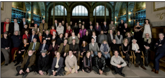
Les écrivains réunis à la BnF Richelieu à l'occasion des 10 ans de Lire et faire lire (2010)